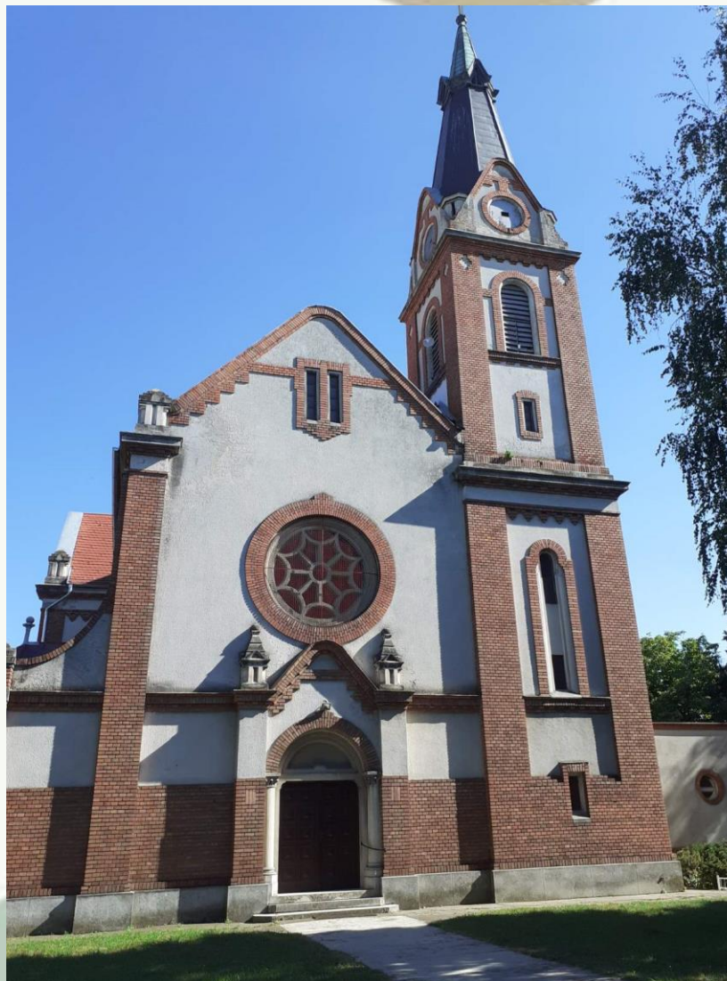
Rímsko-katolícky kostol sv. Alžbety na Telepe v Novom Sade v roku 1931