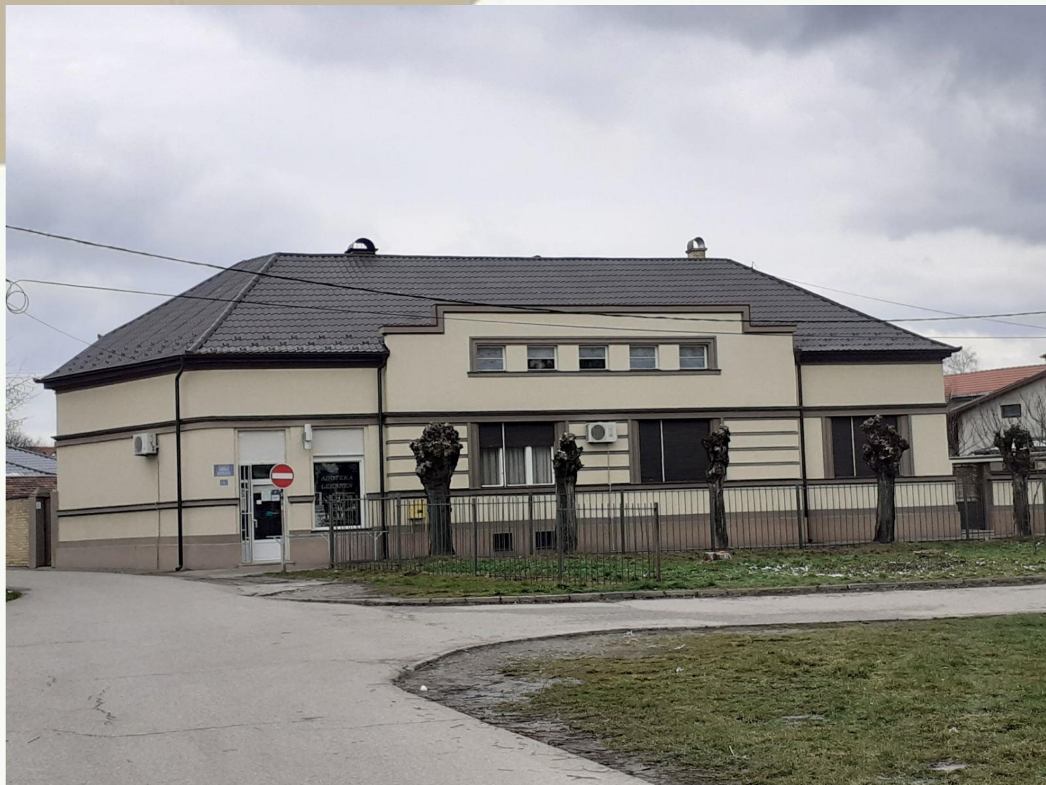
Čáňov rodinný dom v Petrovci na ulici Ľudovej revolúcie pri trhovisku