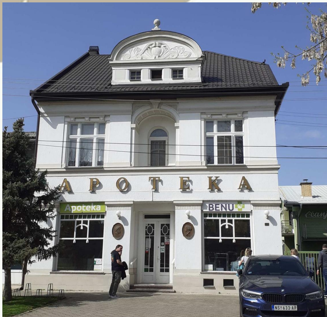
Čáňov rodinný dom s obchodným priestorom v Petrovci.