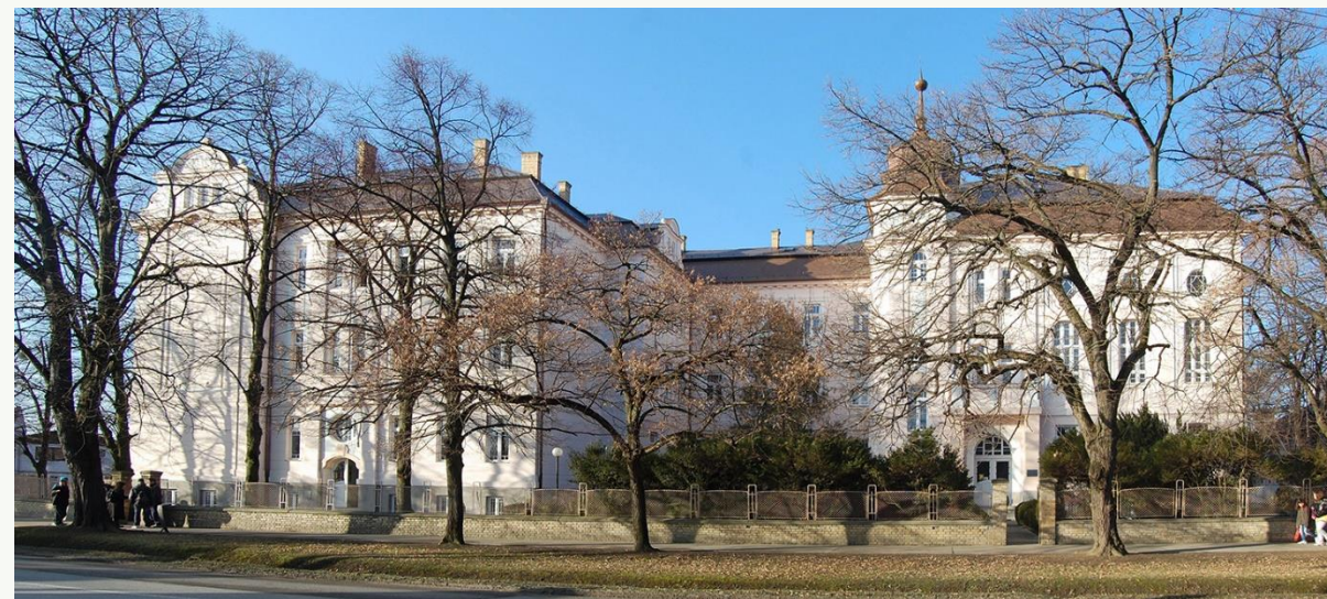
Slovenské gymnázium v Petrovci roku 1926